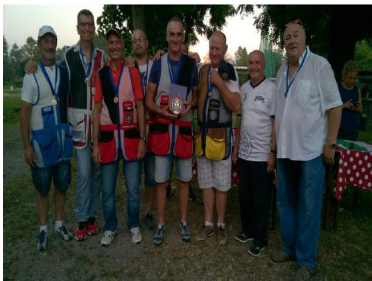
Il Tav Le Bettole