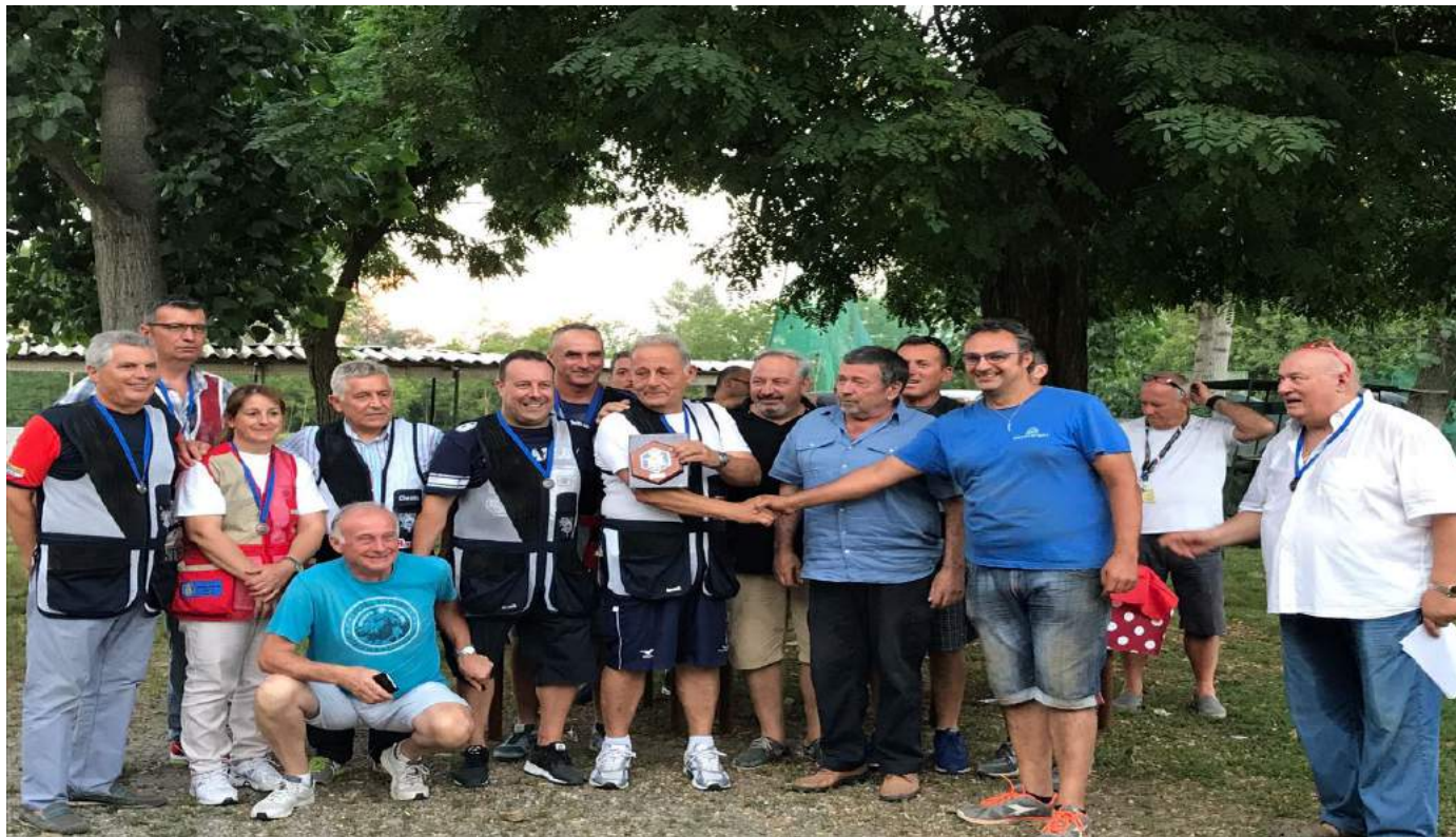
Il Tiro a volo Basaluzzo campione regionale a squadre