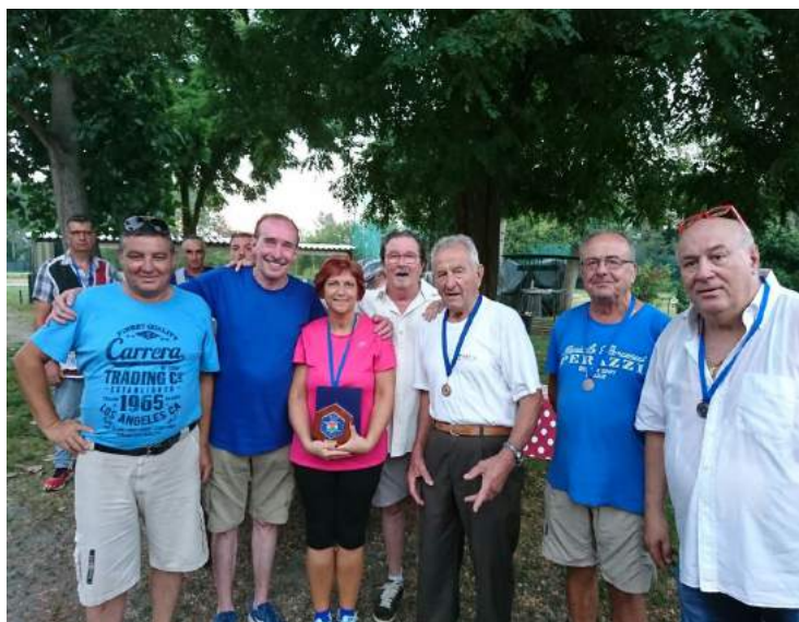
Il Tav Baldissero "Peroglio"