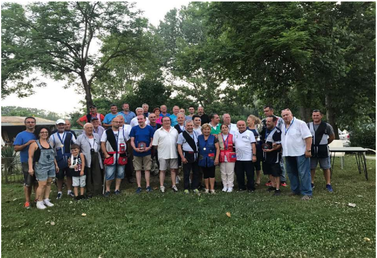
I partecipanti alla cerimonia di premiazione